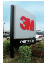
1980年代、高い信頼性が求められる看板の部材固定用途で、革新的な接合方法として採用されました。

工業用の超強力両面テープとして発売して以来、過酷な用途で使用されています。20年以上の屋外暴露の試験でも顕著な接着力の低下が見られない*など、優れた耐久性を発揮します。現在では、様々なものづくりの現場にて、革新的な接合方法として採用されています。* 神奈川県相模原市の郡社事業所敷地内での評価 Y-4920 使用