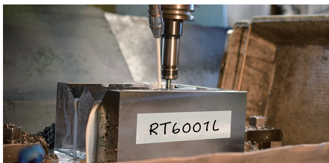
機械設備への貼付メモ用として