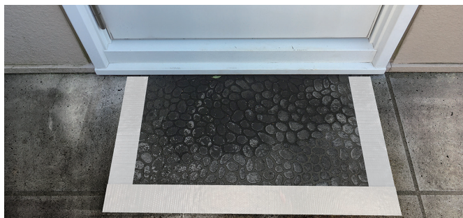
マット等の固定用として