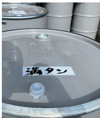
ドラム缶への貼付用として