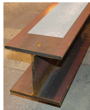
鉄部材への貼付用として