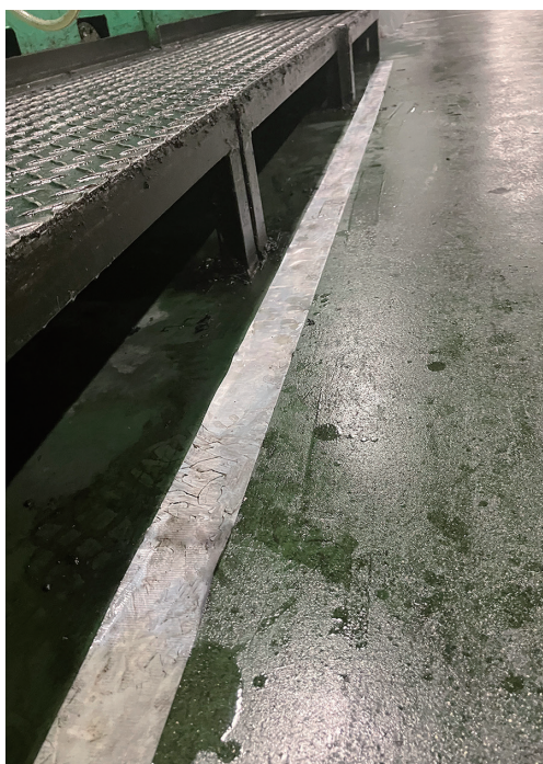
工場内でのラインテープとして

油の付いた面への貼付に。 様々なシーンに合わせてテープ色（白/黄）をお選び頂けます。